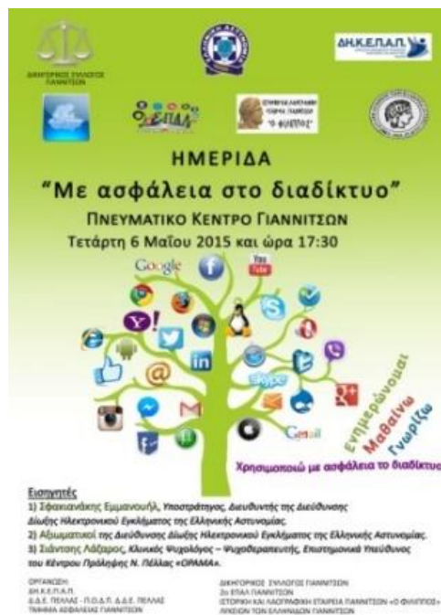
Σχήμα 2: Η αφίσα της ημερίδας.