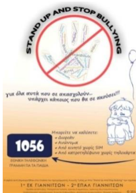
Σχήμα 3: Η ενημερωτική αφίσα.

Η δεύτερη αφίσα που φτιάχτηκε από το μαθητή ήταν ενημερωτική σχετικά με το νούμερο 1056 που μπορούν να καλέσουν οι μαθητές για να ζητήσουν βοήθεια αν αισθανθούν ότι κινδυνεύουν από οποιαδήποτε μορφή εκφοβισμού.