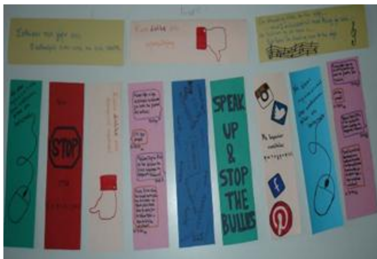
Εικόνα 4: Σελιδοδείκτες με μηνύματα κατά της βίας.

Όλες αυτές τις εβδομάδες ασχολούνταν παράλληλα με τη συγγραφή του σεναρίου για την ταινία, την κατανομή ρόλων, την επιλογή της μουσικής επένδυσης και τις λοιπές λεπτομέρειες δίνοντας και λαμβάνοντας ανατροφοδότηση από τους συμμαθητές τους. Πράγματι, η ταινία γυρίστηκε σε μία ημέρα που οι υπόλοιποι μαθητές του σχολείου έλειπαν σε εκδρομή, έτυχε επεξεργασίας από όσα μέλη είχαν τις κατάλληλες γνώσεις και, αφού αξιολογήθηκε ως αξιοπρεπής, ανέβηκε στο YouTube ( https://www.youtube.com/watch?v=yHIEsrrwc4k ).