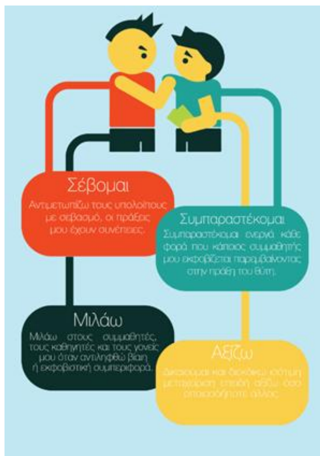
Εικόνα 3: Infographic με μέτρα προστασίας από τον εκφοβισμό.

ευρήματα. Ομολογουμένως, τα στατιστικά στοιχεία υπήρξαν σοκαριστικά τόσο για τους μαθητές όσο και για τους εκπαιδευτικούς. Είναι χαρακτηριστικό ότι σύμφωνα με στοιχεία της Ελληνικής Αστυνομίας, (2002), στο 20% των περιστατικών βίας στα ελληνικά σχολεία χρησιμοποιήθηκαν όπλα!