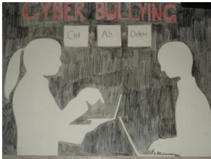
Εικόνα 2: Αφίσα ενάντια στον διαδικτυακό εκφοβισμό.