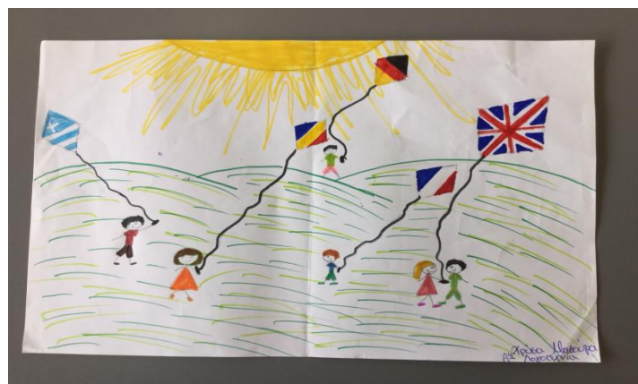
Σχήμα 5: Από το κείμενο “Τα τσερκένια” του Κ.Πολίτη.