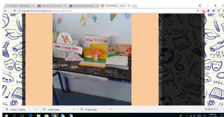
Σχήμα 6: Από τα κείμενα “Το πιο γλυκό ψωμί” -Λαϊκό Παραμύθι και “Μανιτάρια στην Πόλη” του Ι.Καλβίνο.

Οι μαθητές εργάζονται ομαδοσυνεργατικά, δημιουργούν και εκφράζονται μετά την ερμηνευτική ανάλυση των κειμένων. Έτσι το λογοτεχνικό κείμενο γίνεται η αφετηρία για δημιουργική ανάγνωση και έκφραση.