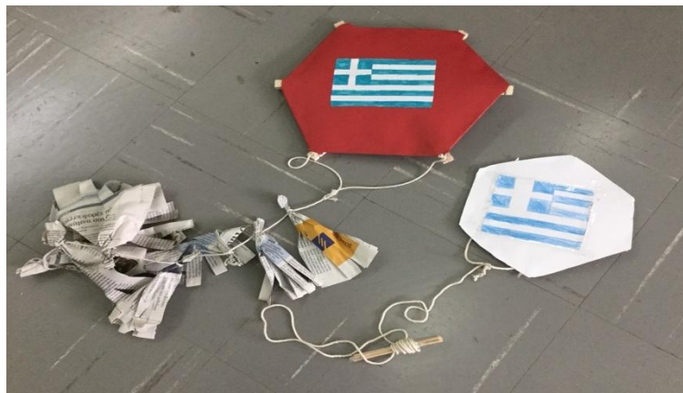
Σχήμα 2: Από το κείμενο “Τα τσερκένια” του Κ.Πολίτη.

Με την παραπάνω μεθοδολογία οι μαθητές κατασκευάζουν τα έργα τους με τη βοήθεια προγράμματος ζωγραφικής ή με διάφορα υλικά και τα αναρτούν στο ιστολόγιο της τάξης (Σχήμα 2). Στα Σχήματα 2, 3 και 4 απεικονίζονται οι αναρτημένες στο blog εργασίες των μαθητών από τα κείμενα “Τα τσερκένια” του Κ.Πολίτη, “Το πιο γλυκό ψωμί” (Λαϊκό Πραμύθι), “Τα φαντάσματα” της Μ.Ιορδανίδου και “Μανιτάρια στην Πόλη” του Ι.Καλβίνο.