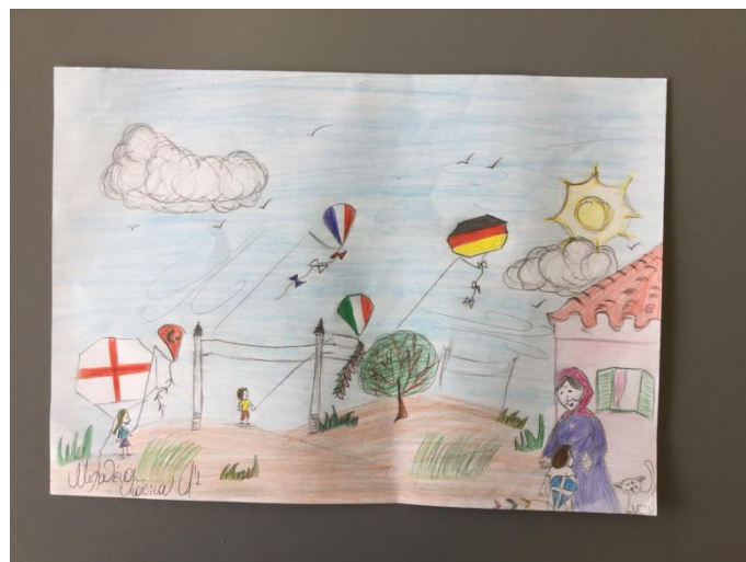
Σχήμα 4: Από το κείμενο “Τα τσερκένια” του Κ.Πολίτη.