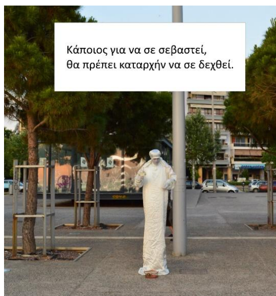
Εικόνα 3: Σεβασμός στη διαφορετικότητα.