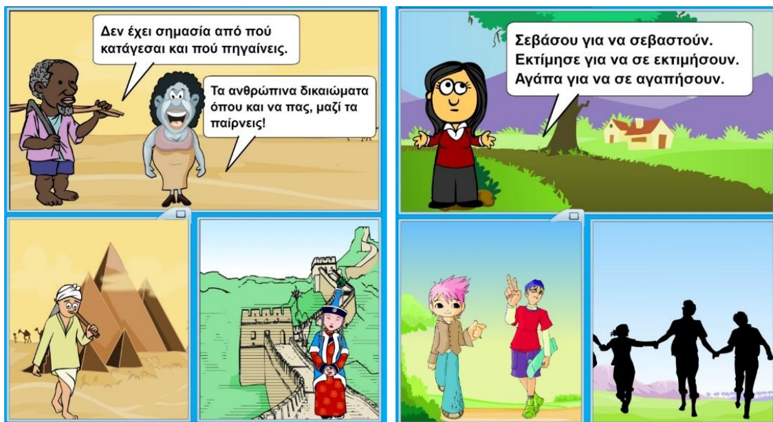
Εικόνα 7: Ανθρώπινα δικαιώματα.