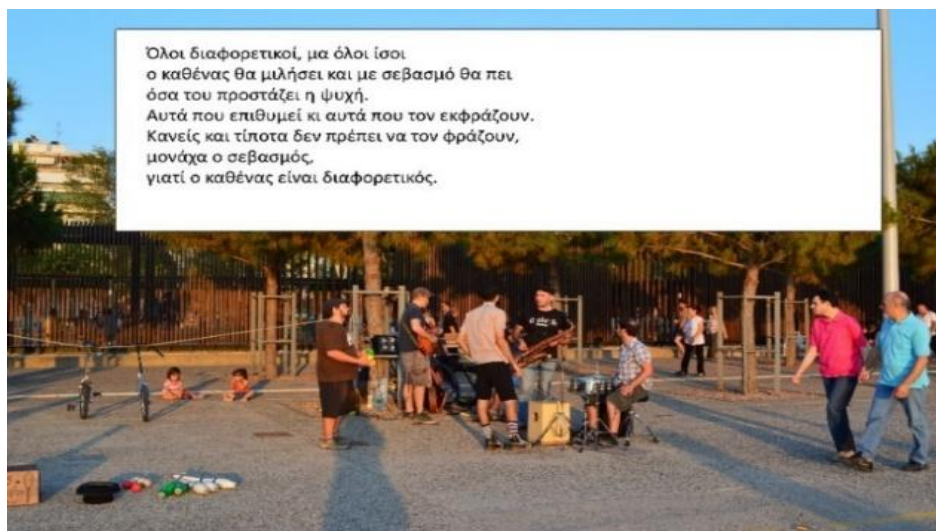
Εικόνα 2: Έλευθερία έκφρασης