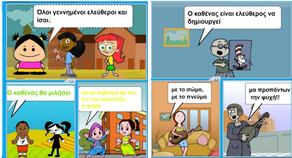
Εικόνα 5: Ελευθερία λόγου.

Έπειτα δημιουργήσαμε comics με το εργαλείο TOONDOO ( www.ToonDoo.com ) με σκοπό και πάλι να ενσωματώσουμε σ' αυτά τους στίχους από τα ποιήματα που δημιουργήσαμε και να περάσουμε τα μηνύματα που εμπνευστήκαμε, όπως φαίνεται στις εικόνες 5-10.