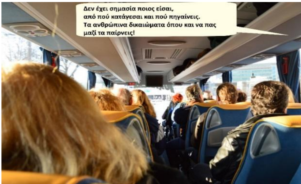
Εικόνα 1: Ανθρώπινα δικαιώματα.

Ακολούθησε το «Πες το με εικόνες...» : Επεξεργαστήκαμε δικές μας φωτογραφίες στον Η/Υ με το ελεύθερο πρόγραμμα Paint.Net ( https://www.getpaint.net ) και ενσωματώσαμε σ' αυτές στίχους από τα ποιήματα που εμπνευστήκαμε υπέρ των ανθρωπίνων δικαιωμάτων, όπως φαίνεται στις εικόνες 1-4.