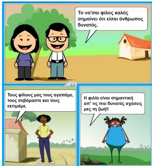
Εικόνα 9: Φιλία.