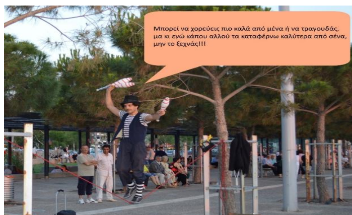
Εικόνα 4: Όλοι διαφορετικοί μα όλοι ικανοί και ίσοι.