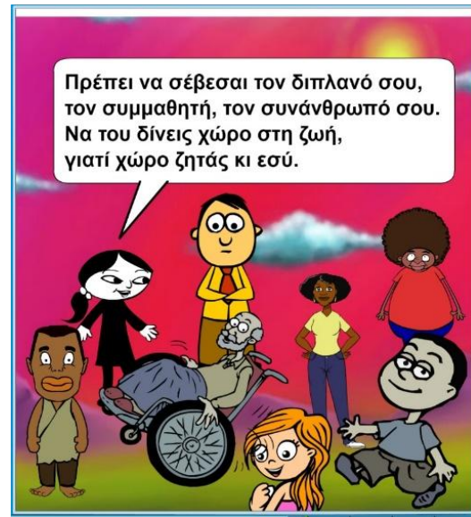
Εικόνα 10: Σεβασμός και αποδοχή.

Τέλος δημιουργήσαμε συννεφόλεξο με λέξεις όπως φιλία, ειρήνη, αγάπη, αλληλεγγύη, σεβασμός, κ.τ.λ. με το εργαλείο Tagul ( www.Tagul.com ) όπως φαίνεται στην εικόνα 11.